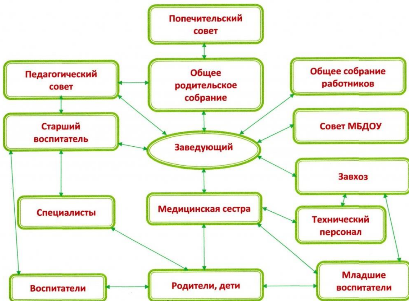
Схема 1. Организация структуры управления МБДОУ д/с "Звездочка".

Управление детским садом осуществляется на принципах единоначалия и самоуправления. Управляющая система состоит из двух структур, деятельность которых регламентируется Уставом МБДОУ и соответствующими положениями, имеет управляемую и управляющую системы.